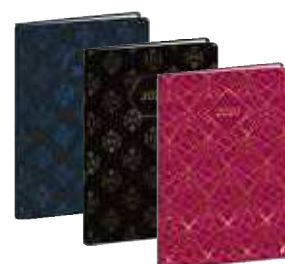
15 x 21 cm gemustert