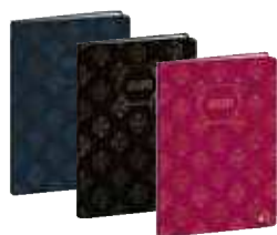
10 x 15 cm gemustert