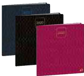
16 x 16 cm gemustert